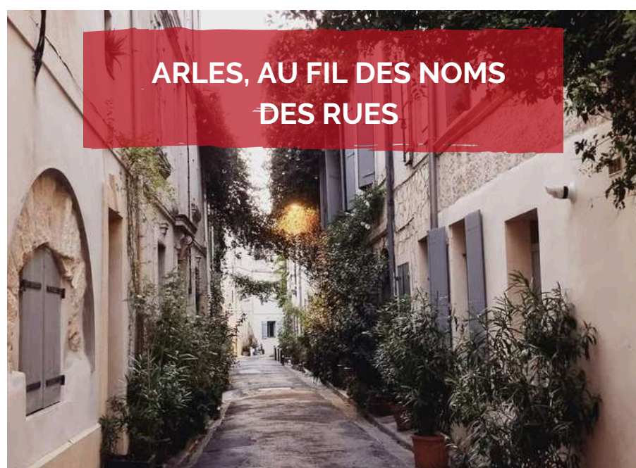
ARLES, AU FIL DES NOMS DES RUES